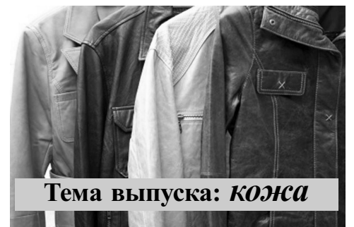
Тема выпуска: КОЖА

Для массового ширпотреба, особенно в кожгалантерее, сегодня используется так называемая прессованная кожа . Несмотря на свое природное происхождение, ее получают под давлением из отходов натуральной, она все же относится к разряду искусственных материалов.